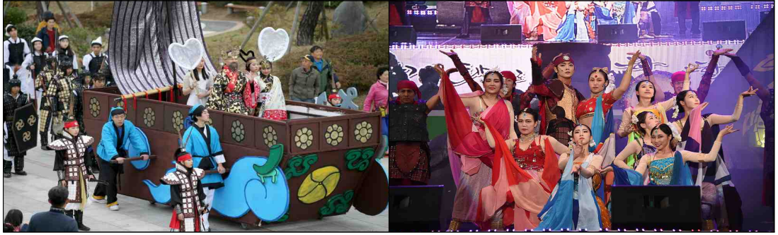
▶허왕후 신행길 축제 모습